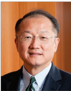
Jim Yong Kim Presidente, Banco Mundial

La lucha contra el fraude y la corrupción es una responsabilidad del Grupo del Banco Mundial que reviste vital importancia. Asegurar que nuestros esfuerzos sean eficaces y generen cambios sostenibles a través del buen gobierno y de instituciones sólidas es fundamental para la labor que desarrollamos a diario, orientada a eliminar la pobreza y a promover la prosperidad. Es para mí un honor haberme incorporado al Grupo del Banco Mundial en un momento en que las enérgicas iniciativas contra la corrupción se han convertido en parte integral de nuestras operaciones en todos los niveles: desde el plano local hasta el ámbito mundial.