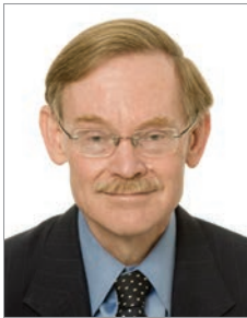
Robert B. Zoellick

Robar a los pobres es repudiable. El Grupo del Banco Mundial tiene una obligación fiduciaria de garantizar que sus recursos se utilicen para los fines previstos. Por lo tanto, combatir la corrupción es una manifestación profunda de la determinación del Grupo del Banco Mundial de superar la pobreza en el mundo y promover el crecimiento y las oportunidades. Es fundamental para nuestra eficacia como institución de desarrollo.