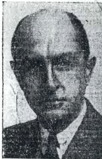
Sr. EUGENE R. BLACK

Director Ejec. Estadunidense del Banco Internacional de Reconstrucción y Fomento