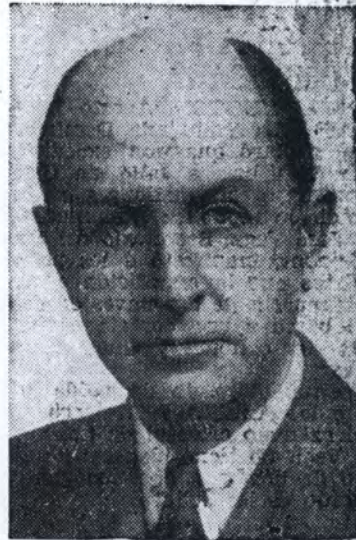
El Sr. Eugene R. Black.

EL DIRECTOR EJECUTIVO ESTADUNIDENSE DEL BANCO INTERNACIONAL DE RECONSTRUCCION Y FOMENTO.