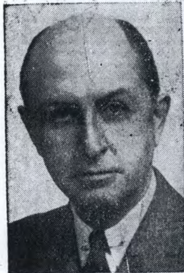
El Sr. Eugene R. Black.

EL DIRECTOR EJECUTIVO ESTADOUNIDENSE DEL BANCO INTERNACIONAL DE RECONSTRUCCION Y FOMENTO