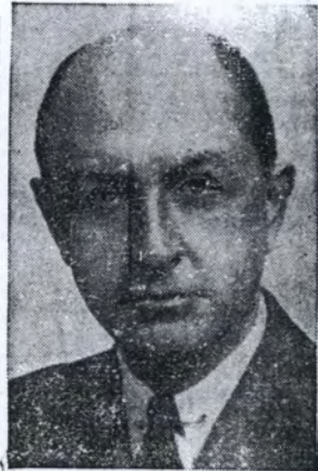
Sr. Eugène R. Black

El Dtor. Ejecutivo Estadu- nidense del Banco Int. de reconstrucción y fomento