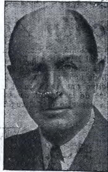
El Sr. Eugene R. Black

Director Ejecutivo Estadounidense del Banco Internacional de Reconstrucción