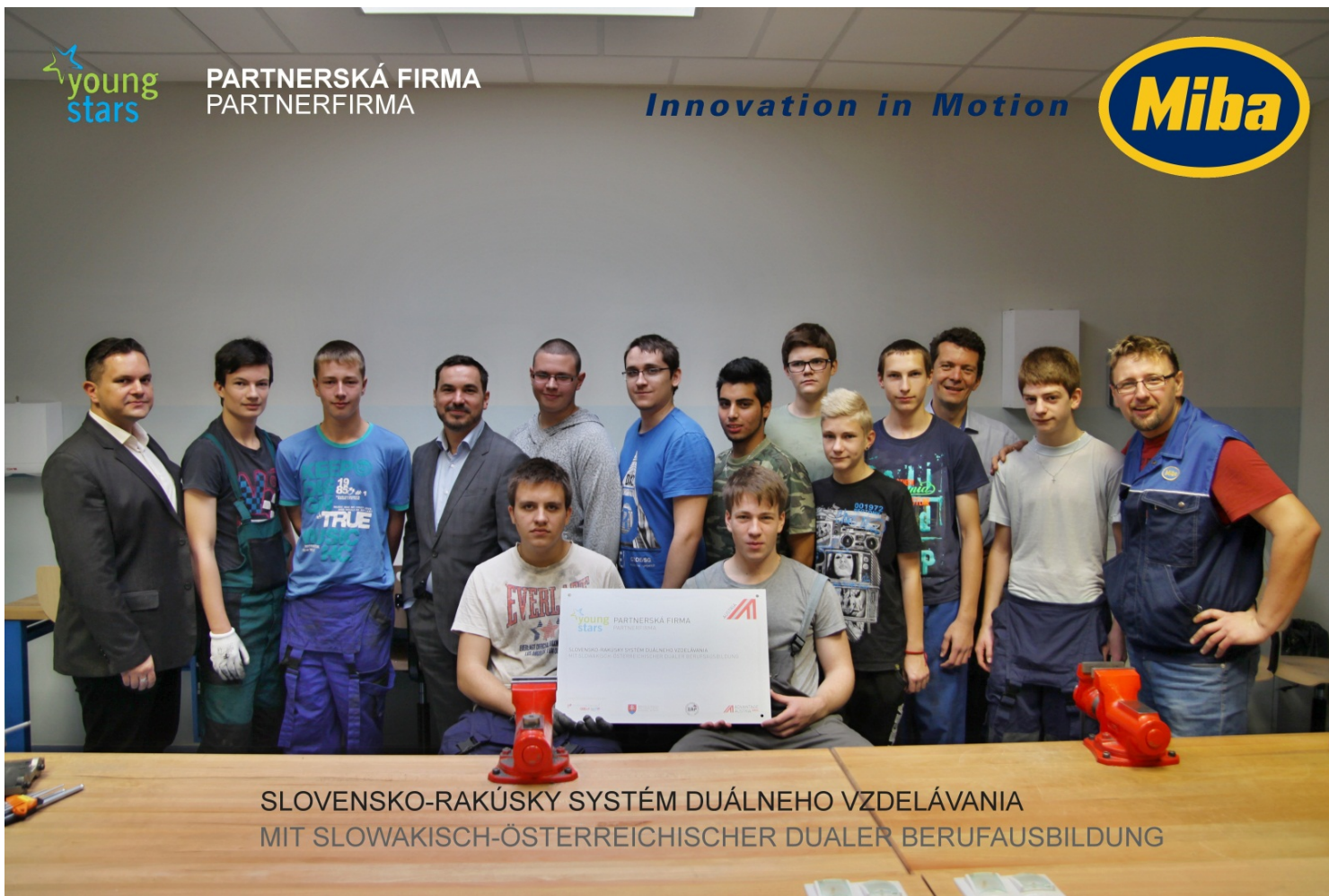
SLOVENSKO-RAKÚSKY SYSTÉM DUÁLNEHO VZDELÁVANIA MIT SLOWAKISCH-ÖSTERREICHISCHER DUALER BERUFAUSBILDUNG