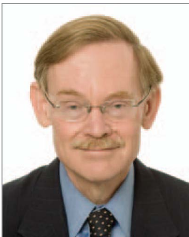
Robert B. Zoellick Presidente, Banco Mundial

O desafio do Grupo Banco Mundial é superar a pobreza global e impulsionar o crescimento e as oportunidades. O desafio deve caminhar lado a lado com o combate à fraude e corrupção para sermos eficientes e construirmos uma mudança sustentável por meio da boa governança e instituições. O vínculo entre estes dois elementos é forte: a pobreza convida à fraude e corrupção; porém, ao distorcer o regime de direito e enfraquecer o fundamento institucional do qual depende o crescimento econômico, a fraude e a corrupção solapam o desenvolvimento e aprofundam a pobreza.