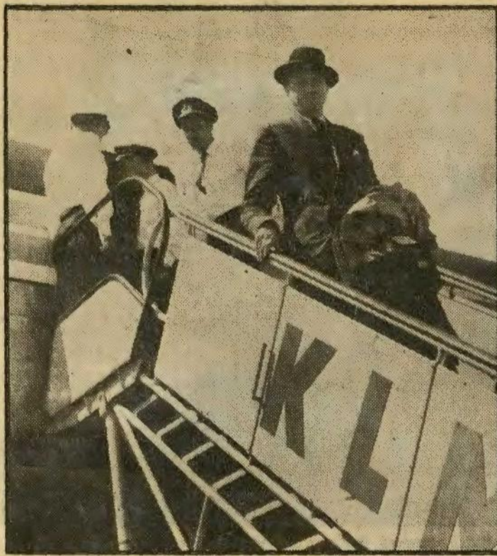
A BOVE photo shows World Bank President Eugene Black, who arrived at Cairo Airport yesterday morning aboard a Dutch KLM liner from Pakistan. Mr. Black is expected to have talks with the U.A.R. Government about the development of the Suez Canal before flying on to London.