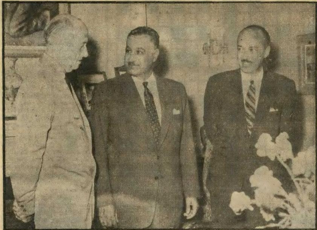
P RESIDENT GAMAL ABDUL NASSER yesterday had a meeting with Mr. Eugene Black, Governor of the World Bank, which was attended by Dr. Abdul Moneim el Kaissuni, U.A.R. Central Minister of Economy. Picture was taken at the meeting.