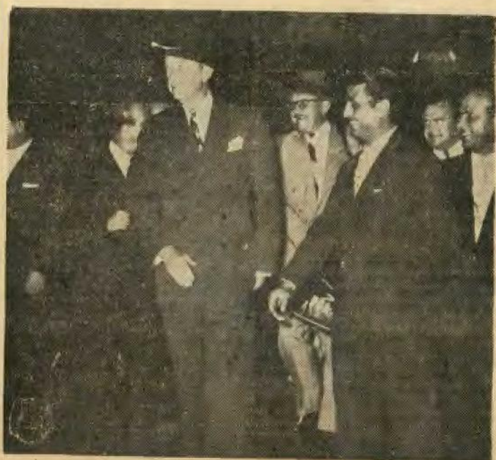
Samedi soir est arrivé de Londres à bord d'un avion de l'"Olympic Airways" le président de la Banque Internationale, M. Eugène Black. Il a été reçu à l'aérodrome par le ministre de l'Economie et du Trésor au gouvernement central, M. le Dr. Abdel Moneim EL-Kayssouni et par d'autres personnalités.

M. Black quittera Le Caire demain, mardi, à destination de l'Inde.