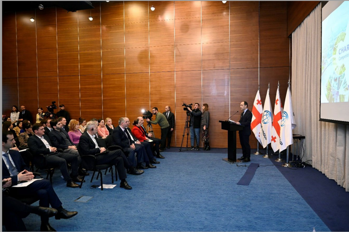
საქართველოს ეკონომიკური მემორანდუმის საჯარო პრეზენტაცია, 6 დეკემბერი 2022 წ., თბილისი, საქართველო.